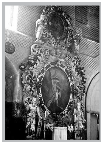
Fot. 5. Ołtarz Aniołów

W momencie podjęcia prac konserwatorskich jego stan zachowania był bardzo zły. Drewno zniszczone było w 80% na skutek działalności owadów, wilgoci i częstych zmian temperatur. Do tego dochodził brak klimatyzacji. Obraz w zwieńczeniu zaatakowany był ponadto przez pleśń. Jedna z figur górnych zachowała się tylko we fragmentach. Drewno ram było porozklejane. Figury i ornamentyka zachowały się tylko dzięki warstwie złocień i powierzchni zewnętrznej. Dużym problemem był rozwój grzybów oraz braki w gruntowaniu. Wszystko to zostało poddane konserwacji i zabezpieczone 55 .