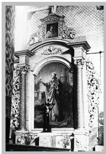
Fot. 8. Ołtarz św. Barbary

Datowany jest on na XVII wiek. W części środkowej umieszczony został duży, prostokątny obraz, malowany na płótnie olejem. Jest półkoliście zamknięty. Widzimy na nim św. Barbarę ubraną w ugrową szatę oraz płaszcz w kolorze rozbielnego kraplaka. W prawej ręce trzyma ona kielich z hostią. W tle widoczna wieża. W zwieńczeniu natomiast inny obraz wspomnianej świętej. W kształcie prostokąta o wymiarach 60x40 centymetrów. Malowany jest farbami olejnymi na płótnie. Św. Barbara przedstawiona jest na nim do połowy, w białej sukni i czerwonym płaszczu. Prawą rękę trzyma na piersiach, w lewej zaś dzierży małą wieżę z trzema okrągłymi oknami. Jej głowa okolona jest długimi pasmami włosów, delikatnie opadającymi na plecy i zwieńczona koroną. Wzrok świętej kieruje się ku górze. Powstanie tego obrazu datuje się na wiek XVIII 65 .