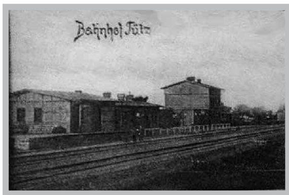
Rys 2. Widok dworca na pocztcówce z początku XX wieku

W związku z tak korzystnymi warunkami, 16 marca 1925 roku została zawarta umowa pomiędzy kierownikiem poczty Tilsnerem, który działał w imieniu Poczty Rzeszy Niemieckiej, a gminą Tuczn.