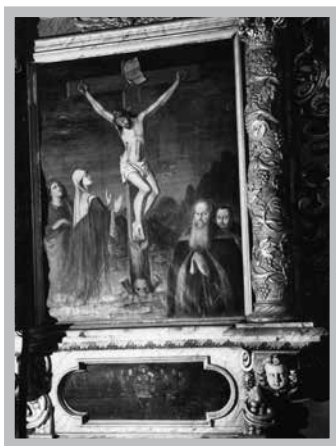
Fot. 3. Ołtarz Ukrzyżowania