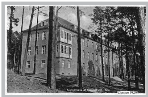
Fot 1. Fundacja św. Elżbiety w październiku 1929 roku na pocztówce (kopia w zbiorach M.J. Garbacza)

Już w latach 20. XX wieku okazało się jednak, że szpital św. Józefa jest niewystarczający. Głównym problemem był brak miejsc dla nowych chorych, którzy zgłaszali się do owej placówki. Kiedy do Tuczna przybył administrator apostołski Maximilian Kaller 7 , w asyście dyrektorów Caritas-Johannesa van Acken i Franza Westpfahla, matka przełożona Calasanzia von Sychowski zaproponowała plan rozbudowy Domu św. Józefa. Wszystkim zgromadzonym wiadome było, że potrzebne są kolejne pomieszczenia, jednak zamiast rozbudowy starego szpitala postanowiono wybudować nowy, który miał być, jak na tamte czasy, szpitalem nowoczesnym 8 . Na miejsce, w którym stanąć miał nowy budynek, wybrano las niedaleko jeziora.