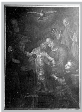
Fot. 7. Ołtarz Świętej Rodziny

Na skrzyni, po środku, na poduszce siedzi Chrystus ubrany w białą, długą i koronkową szatę. Włosy ma ułożone w pukle. Twarz dzieciątka zwrócona została w stronę twarzy swej matki. Maria przedstawiona jest w sukni w kolorze kraplaku i ciemnobłękitnym płaszczu. Jest w pozycji lekko pochylonej i podtrzymuje postać Chrystusa, który w lewej dłoni trzyma różę, prawą zaś dotyka brody Anny, która podaje mu prawą dłonią jabłko, w drugiej zaś trzyma książkę. Łokieć Anny oparty na stole o ciemnoczerwonej zasłonie. Ubrana jest ona w zieloną szatę i kłęczy. Obie kobiety, tj. Maria i Anna mają białe czepce i tkaniny na głowie. Maria dodatkowo posiada opaskę z kamieniem. Za nimi postać Joachima, ubranego w ugorową szatę, z twarzą zwróconą do widza. Dłonią wskazuje na Chrystusa, jakby chciał na Niego zwrócić uwagę widzów. Po przeciwnej stronie postać Józefa w ciemno zielonej szczacie i czerwonym płaszczu. Pochyla się on nad Marią z opiekuńczym gestem. Sam wpatruje się w Chrystusa. U stóp Marii kłęzący anioł, który podaje kosz z owocami. Są w nim jabłka, winne grona i granaty.