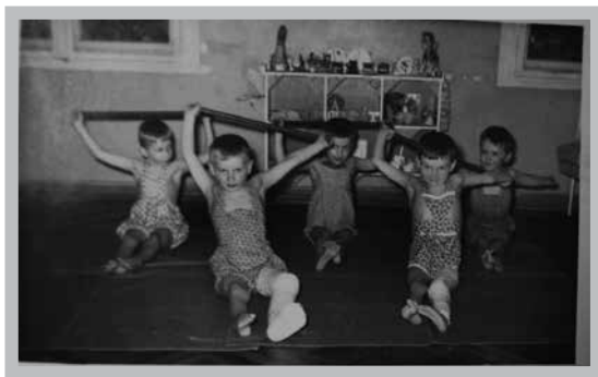
Fot 2. Pacjenci Sanatorium Kostno-Stawowego podczas ćwiczeń

Decyzją Ministerstwa Zdrowia i Opieki Społecznej dnia 1 kwietnia 1951 roku w Tucznie utworzono Sanatorium Kostno-Stawowe dla Dzieci. Znajdowało się w nim 100 łóżek, na których leczono dzieci w wieku od 3 do 7 lat.