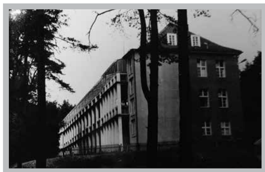
Fot. 3. Widok na sanatorium po dobudowaniu zadaszania nad tarasami w 1967 roku

W roku 1969 sanatorium zdobyło II miejsce w wojewódzkim konkursie na najlepszy przeciwgruźliczny zakład zamknięty. Nagrodą było 10 tysięcy złotych. W roku 1970 uzupełniono wyposażenie laboratorium analitycznego, przebudowano pracownię rentgenowską oraz zakupiono sprzęt zmechanizowany do kuchni. W tym samym czasie z sanatorium zaczęło współpracować, w charakterze konsultantów, pięciu lekarzy specjalistów w dziedzinach: chirurgii, laryngologii, neurologii, radiologii i dermatologii 56 .