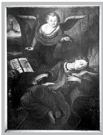
Fot. 6. Ołtarz św. Marii Magdaleny