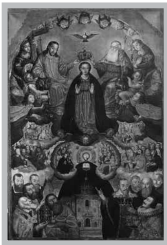
Fot. 1. Ołtarz Koronacji