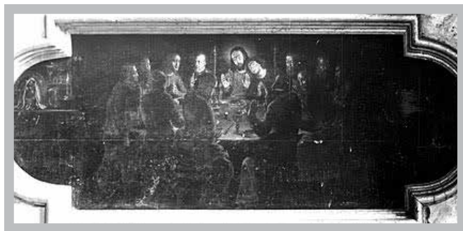
Fot. 4. Ostatnia Wieczerza