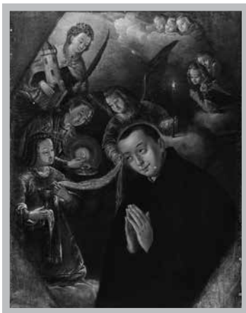
Fot. 2. Św. Stanisław Kostka